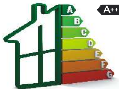
Brügmann AD Termo